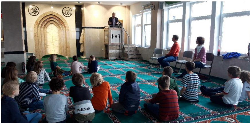
Albanische Moschee in Nürnberg

Das muslimische Leben in Deutschland ist außerordentlich vielfältig organisiert. Die Moscheen sind vor allem ethisch geprägte Moscheen, je nach ursprünglichen Herkunftsländern (Türkei, Albanien, Bosnien, arabisch sprachige Länder, Pakistan u.a.)