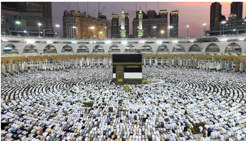
Kaaba in Mekka

Der zentrale Inhalt des Islam sind die sogenannten ›fünf Säulen‹: Das Glaubensbekenntnis (schahada; „Es gibt keine Gottheit außer Gott, Mohammed ist der Gesandte Gottes“). Das täglich fünfmalige Gebet (salat) in arabischer Sprache. Das Fasten im Monat Ramadan (saum). Die Pflichtabgabe (zakat) und einmal im Leben im Wallfahrtsmonat die Wallfahrt nach Mekka (hadsch).